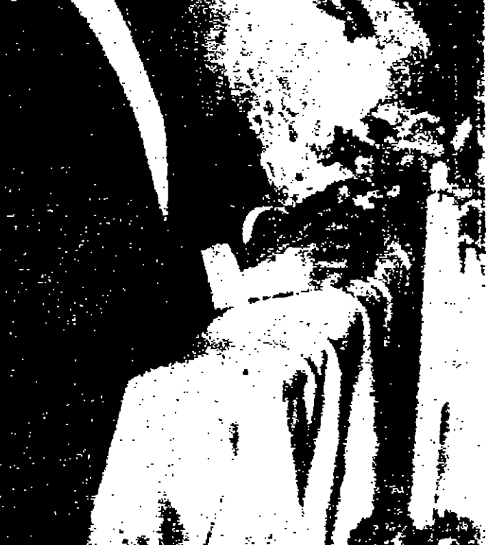
نجم الميميز في أولياد ١٩٦٨ القنطرة الشمالية الجبلية في كاتلاساك انلاه عند قرانيا اس على زميلها نجم التشيكوسلوفاكي جوزف اولوزيل في كاتلاساك مسكيو

ماذا ضربت مصفاة البترول؟ ويشير الرافدين إلى حادثة العراق الأخيرة الإسرائيلية ومدى الخلق الذي اتلبه السلطان الإسرائيلي من جراء هذه الضارة وما نفعا حثت السويس القليل الحرة فوق مدينة السويس مسهولت خزانات التورين فيها لتلحق الضائر المالية أنفقا خسارتهم التي حدثت في عرض البحر الأبيض المتوسط. وبالمنس علمت إسرائيل إلى توجيه الضرب والصواريخ التي صهريج البترول والأحواض الكيماوية الحديثة السويدي ومنطقة الشط والمسان مبرهنة على أن خسارها فلاحه جدا وأرادت أن تقوم بنفيتها عن طريق استغلال الخراف في منطقة الزينة التي توجد فيها هذه الصهاريج إلا أن العدو الإسرائيلي نسي أن القوات المصرية قد احتلت قبل هذا القدر لا تحرم من السلطات الإسرائيلية من الأضرار وخسره ولم تكن هذه الصهاريج بطبيعة الحال مملوكة لمل ما يتبادر الأسماء من بترول ومواد سريعة الانهيار كالماء المنفعة والبرازن الكيماوية لم تكن مستغلة العدو التي أقدمت لاداء هذه المهمة من الوصول إلى هدفها بل قامت القوات العربية المسلحة باستكشاف هذه الثيران على الفور